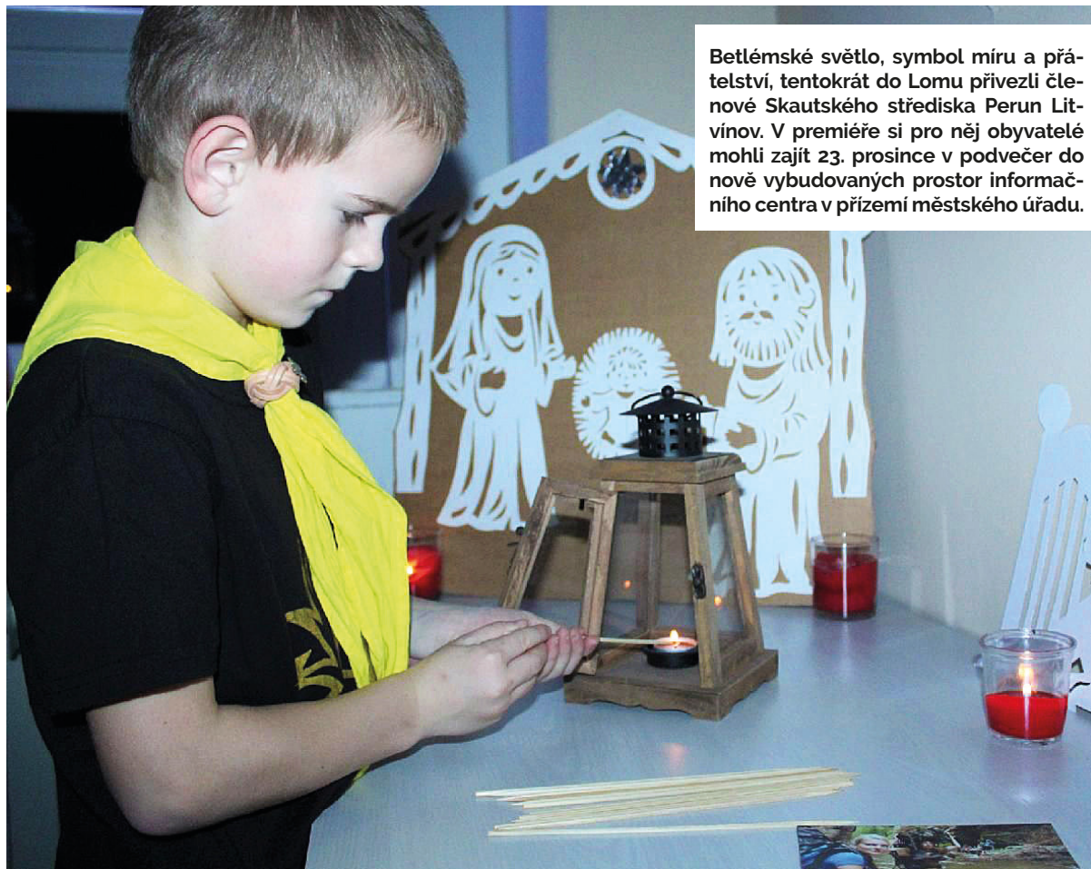
Betlémské světlo, symbol míru a přátelství, tentokrát do Lomu přivezli členové Skautského střediska Perun Litvínov. V premiéře si pro něj obyvatelé mohli zajít 23. prosince v podvečer do nově vybudovaných prostor informačního centra v přízemí městského úřadu.