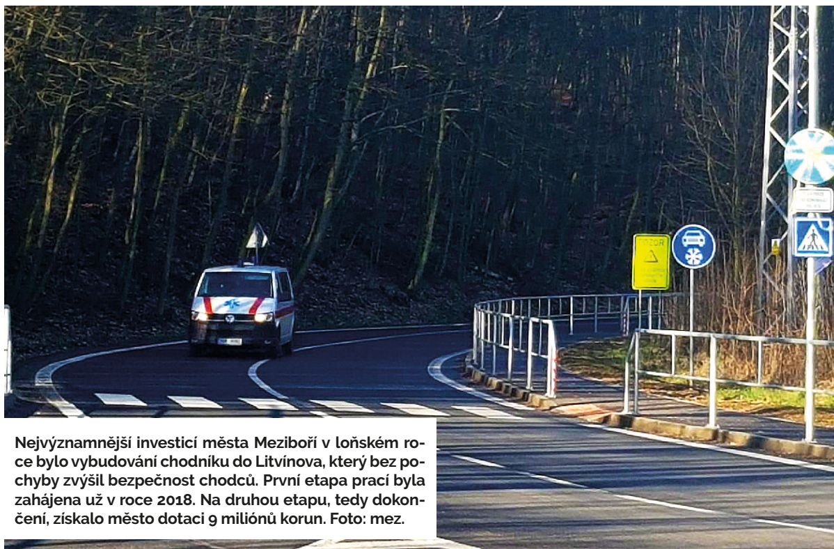
Nejvýznamnější investicí města Meziboří v loňském roce bylo vybudování chodníku do Litvínova, který bez pochyby zvýšil bezpečnost chodců. První etapa prací byla zahájena už v roce 2018. Na druhou etapu, tedy dokončení, získalo město dotaci 9 milionů korun.

2 Příjmy 5 008 000 korun, výdaje 5 868 000 korun. Rozpočet je schválen zastupitelstvem obce jako schodkový a schodek bude pokryt z přebytku finančních prostředků z minulých let. Naši jednoznačnou prioritou pro tento rok je plynofikace všech tří bytových domů ve vlastnictví obce, které jsou doposud vytápěny