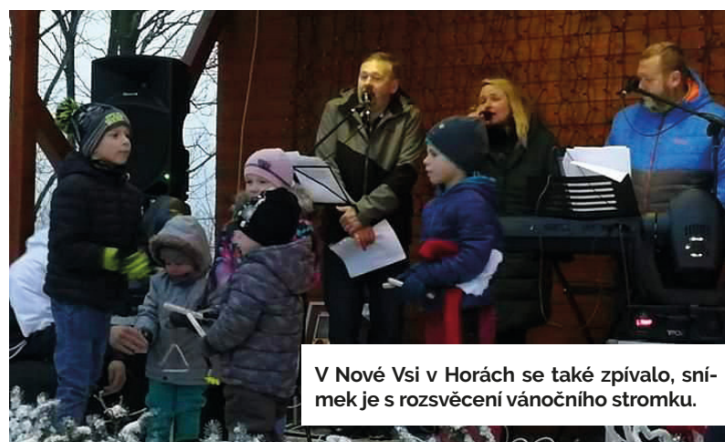
V Nové Vsi v Horách se také zpívalo, snímek je s rozsvěcení vánočního stromku.