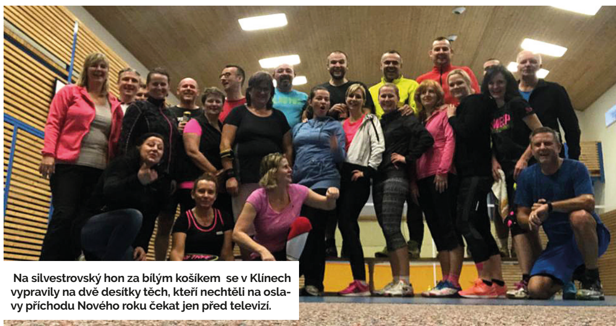
Na silvestrovský hon za bílým košíkem se v Klínech vypravily na dvě desítky těch, kteří nechtěli na oslavu příchodu Nového roku čekat jen před televizí.