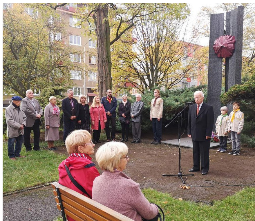
Vedení města Litvínova i Meziboří, členové Základní organizace Českého svazu bojovníků za svobodu Litvínov a Meziboří, členové TJ Sokol Litvínov – Lom a litvínovští skauti si připomněli 101. výročí založení Československé republiky. 24. října uctili památku těch, kteří se tehdy významným způsobem podíleli na tvorbě novodobých dějin a položili za vidinu svobodu své životy, u památníku v Ruské ulici v Litvínově.