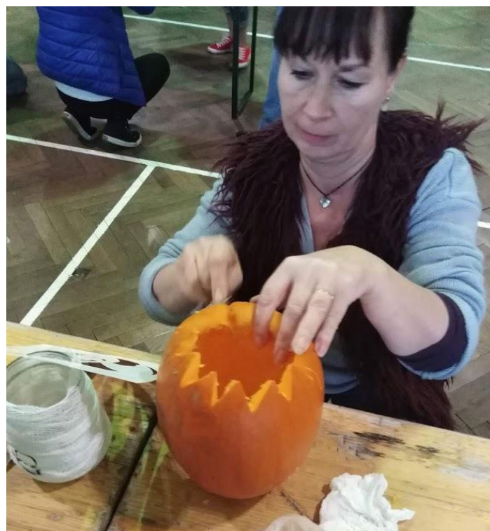
Halloween si získal oblibu i u nás, letos se na něj opět připravovali i v Nové vsi v Horách. Ale nejde o americký svátek, jak se traduje. Jeho kořeny sahají až do dob před naším letopočtem, kdy Keltové slavili v tento den konec léta a příchod nového roku. Halloweenská tradice se díky přistěhovalcům z Irska dostala kolem poloviny 19. století do Ameriky. Irové vyřezávali děsivé obličejy do vydlabané řepy, tu dávali posledního října se zapálenou svíčkou do oken, což mělo od domu vyhnat duše zemřelých. V Americe potom začaly používat dýně. Svíčka do nich vložená má ochránit lidi před zlými silami.