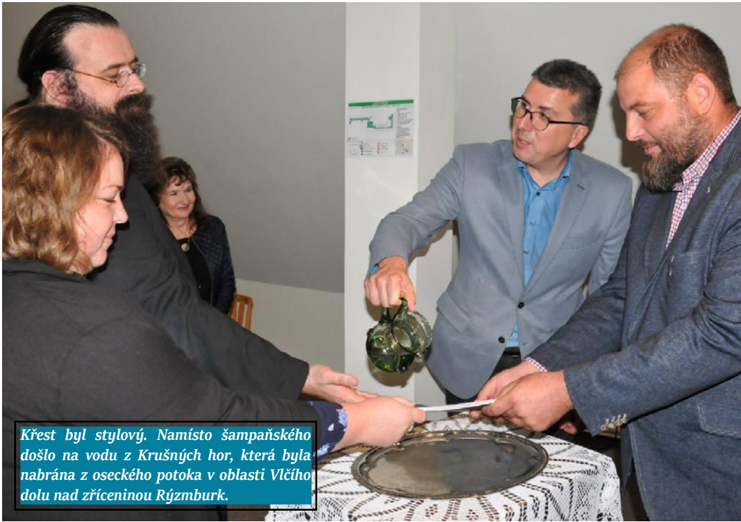
Křest byl stylový. Namísto šampaňského došlo na vodu z Krušných hor, která byla nabrána z oseckého potoka v oblasti Vlčího dolu nad zříceninou Rýzmburk.