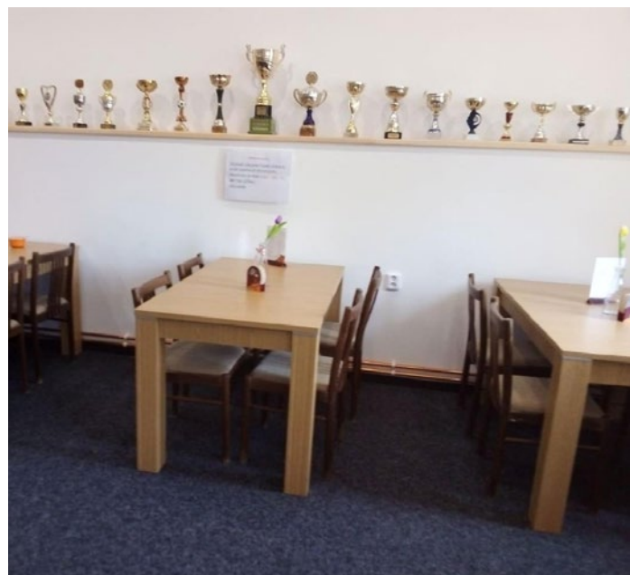
Sokolovna v Nové Vsi v Horách pomalu prochází úpravami. V tomto roce se v tamní klubovně objevily díky pomoci Ústeckého kraje nové stoly. Své rekonstrukce se snad jednou dočká i tělocvična.