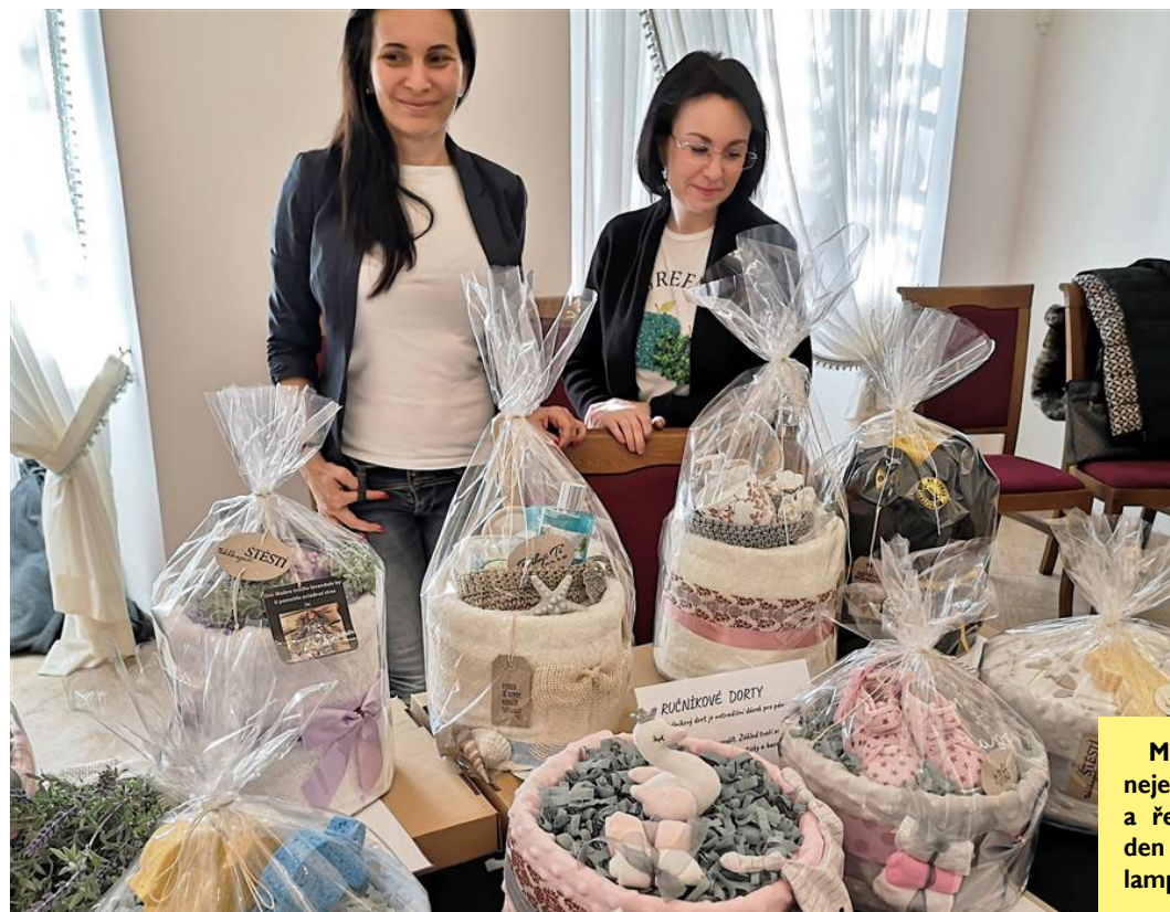
Město Litvínov dnes 28. října pozvalo nejen své občany na Oslavu sklizně a řemesel, která probíhala po celý den v zámku Valdštejnů. Vše zakončil lampiónový průvod a ohňostroj.