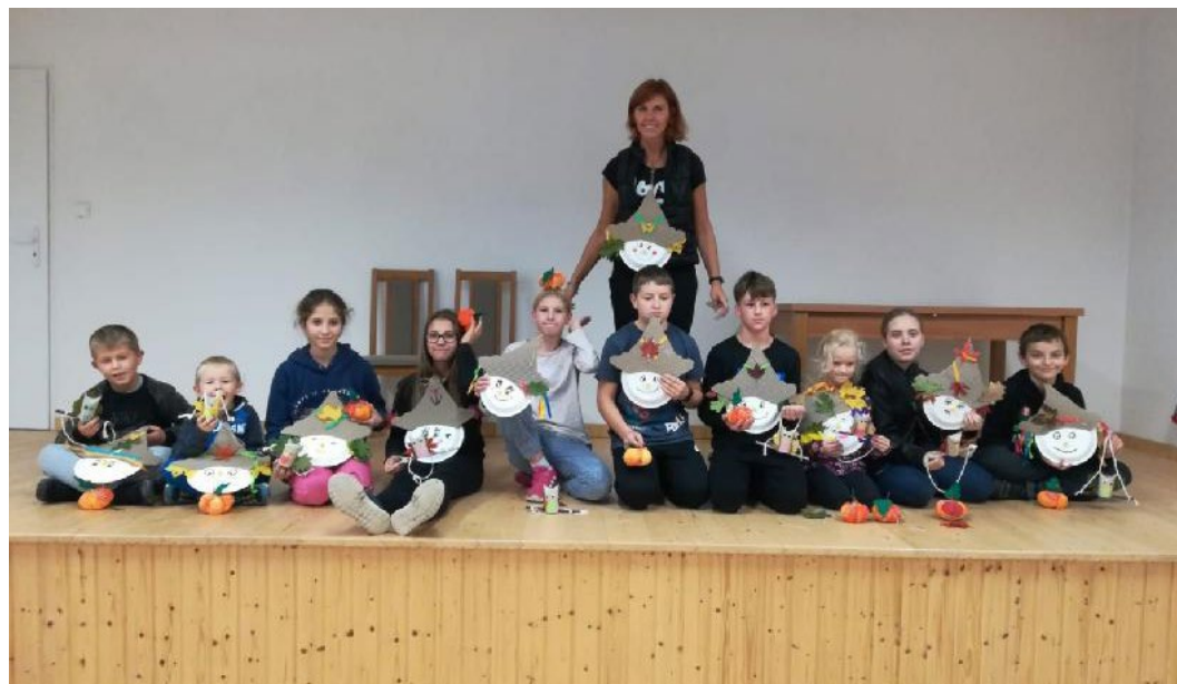
Nejen dospělí, ale i děti mají v Brandově o zábavu postaráno. Jedno z říjnových odpolední patřilo tvořivým rukám.