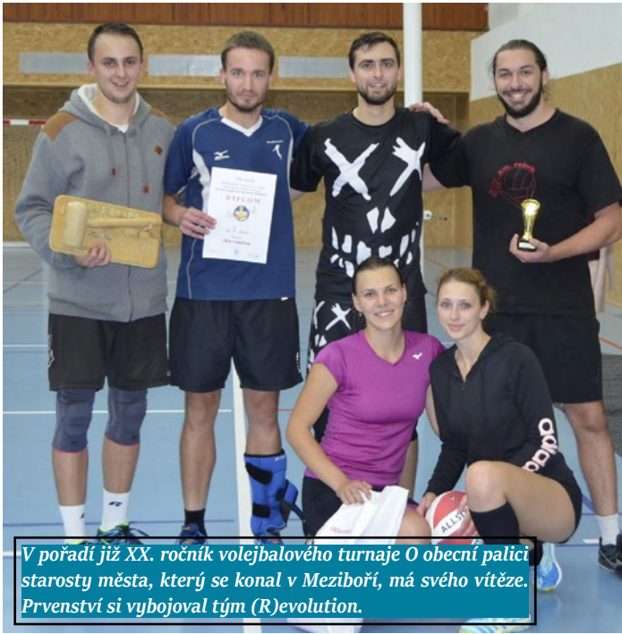
V pořadí již XX. ročník volejbalového turnaje O obecní palici starosty města, který se konal v Meziboří, má svého vítěze. Prvenství si vybojoval tým (R)evolution.