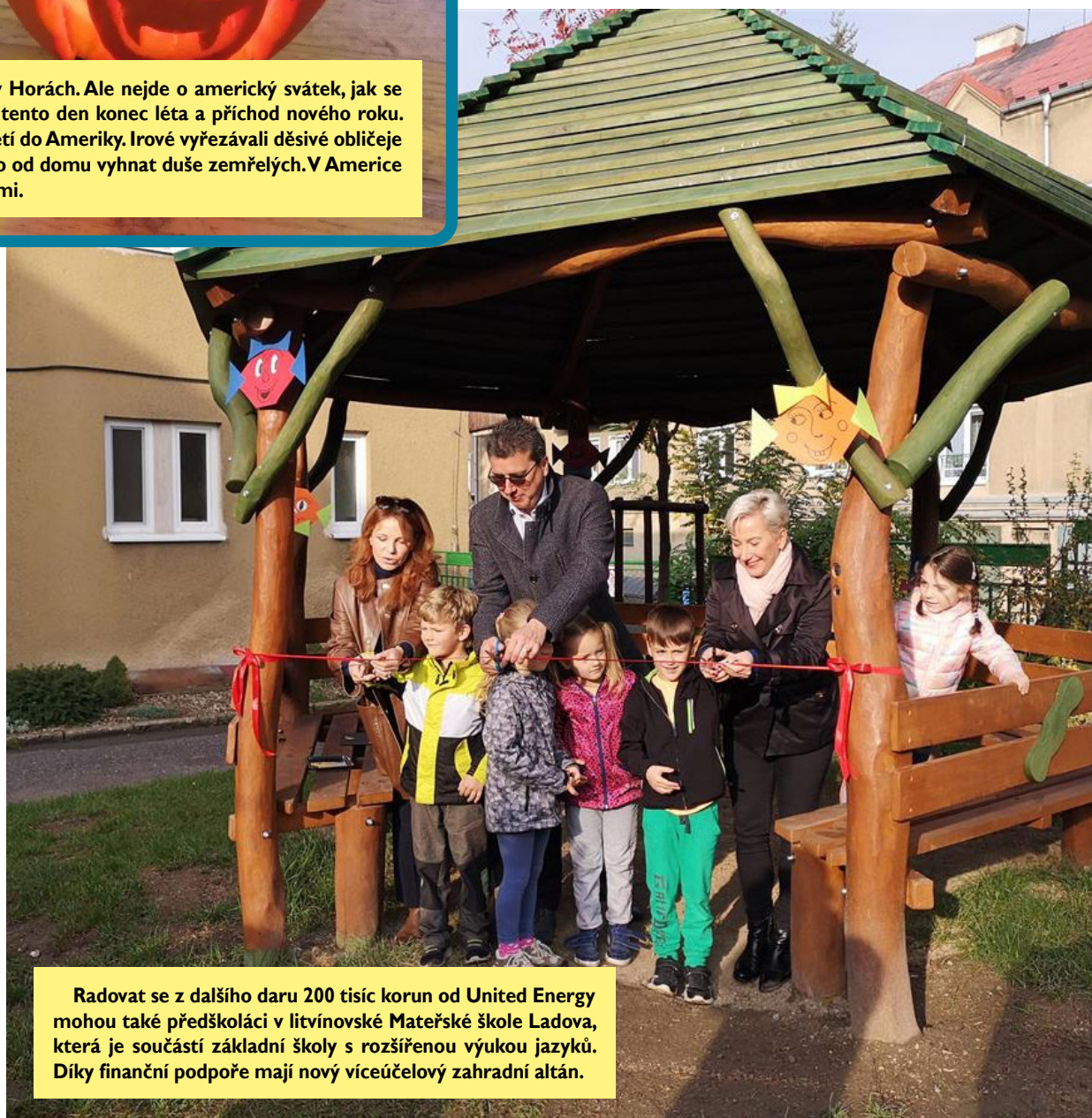
Radovat se z dalšího daru 200 tisíc korun od United Energy mohou také předškoláci v litvínovské Mateřské škole Ladova, která je součástí základní školy s rozšířenou výukou jazyků. Díky finanční podpoře mají nový víceúčelový zahradní altán.